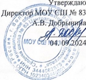
График проведения школьного этапа всероссийской олимпиады школьников 2024-2025 учебного года в МОУ СШ № 83 Центрального района Волгограда